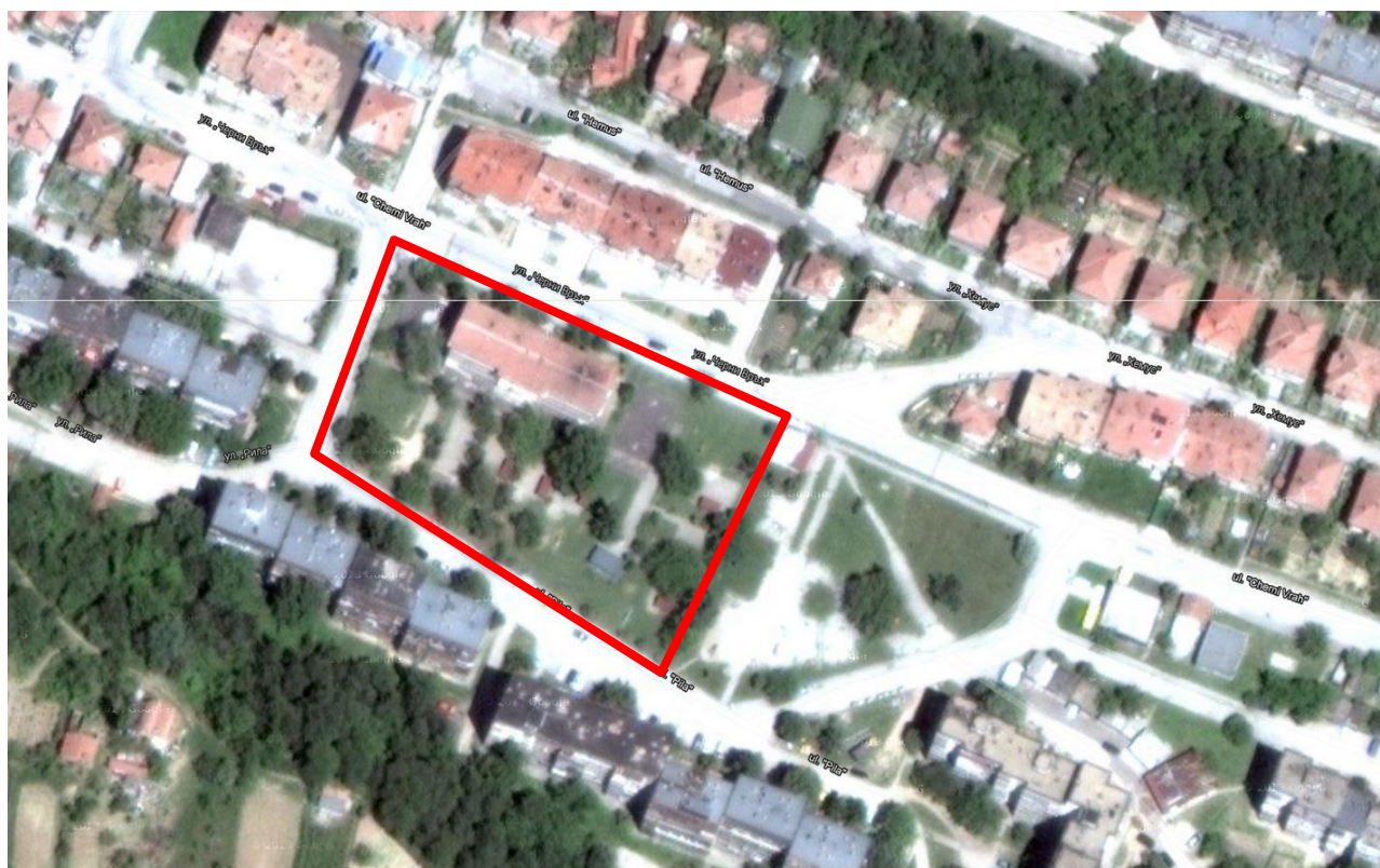
Схема 1. УПИ I, отредено „за детска градина“, кв. 114, гр. Свищов

УПИ I, отредено „за детска градина“, кв. 114, по плана на гр. Свищов граничи на изток с Парк Радост – УПИ II „за озеленяване и спортни дейности“, на запад с ул. Стара планина, на север с ул. Черни връх и на юг – с ул. Рила. Собственикът на имота е Община Свищов. Обектът не се намира в защитени територии или в близост до такива. Инвестиционното намерение не засяга защитени територии и територии за опазване обектите на културното наследство. Не се предвижда промяна на съществуващата инфраструктура. Въздействията от инвестиционното предложение няма трансграничен характер. Не се предвижда промяна на съществуващата пътна мрежа.