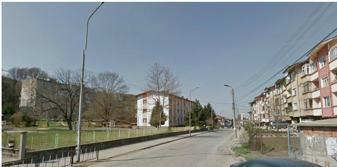
Снимка 2. Съществуваща сграда в УПИ I, отредено „за детска градина”, кв. 114, гр. Свищов

5. Природни ресурси - предвидени за използване по време на строителството и експлоатацията, предвидено водовземане за питейни, промишлени и други нужди - чрез обществено водоснабдяване (ВиК или друга мрежа) и/или от повърхностни води,