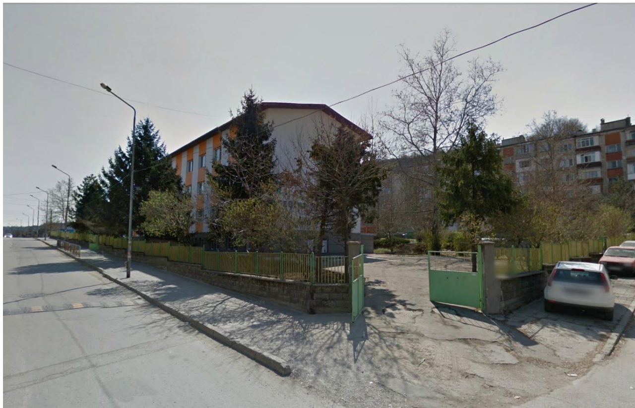
Снимка 1. Съществуваща сграда в УПИ I, отредено „за детска градина”, кв. 114, гр. Свищов