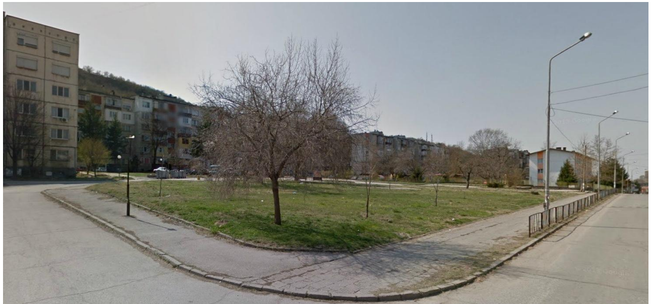
Снимка 1. Съществуваща сграда в УПИ II, отредено „за озеленяване и спортни дейности”, кв. 114, гр. Свищов