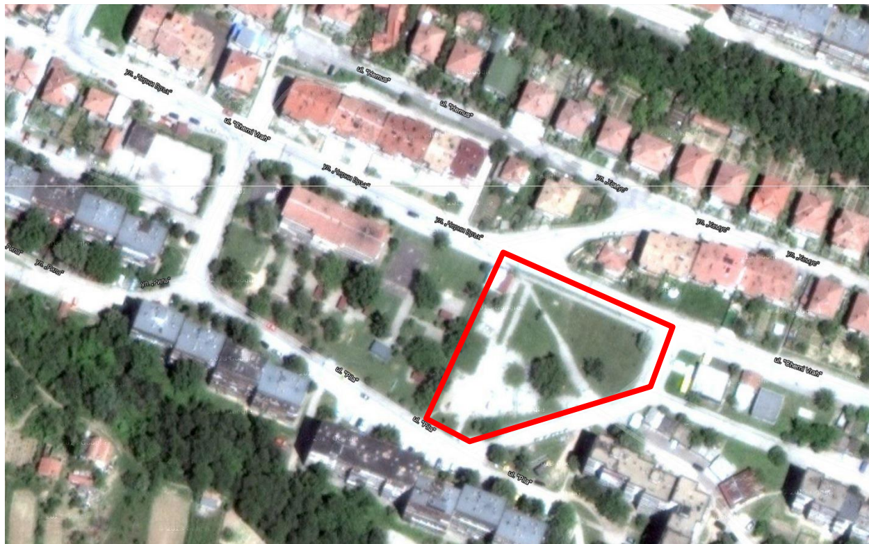
Схема 1. УПИ II, отредено „за озеленяване и спортни дейности“, кв. 114, гр. Свищов

Местоположение: Парк Радост попада в УПИ II, отредено „за озеленяване и спортни дейности“, кв. 114, по плана на гр. Свищов и граничи на изток и юг с ул. Рила, на запад с УПИ I, отредено „за детска градина“ и на север с ул. Черни връх.