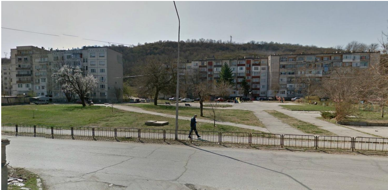
Снимка 2. Съществуваща сграда в УПИ II, отредено „за озеленяване и спортни дейности“, кв. 114, гр. Свищов

5. Природни ресурси - предвидени за използване по време на строителството и експлоатацията, предвидено водоземане за питейни, промишлени и други нужди - чрез обществено водоснабдяване (ВиК или друга мрежа) и/или от повърхностни води, и/или подземни води, необходими количества, съществуващи съоръжения или необходимост от изграждане на нови