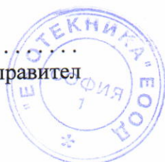
Камен Косев - Управител